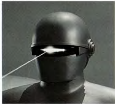
ill. 12 Still uit 'The Day the Earth Stood Still', Regie Robert Wise, 1951