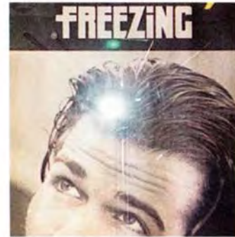
ill. 14 Detail uit FREEZING (zie pagina 47)