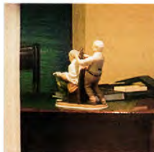
ill. 11 Detail uit FREEZING (zie pagina 47)